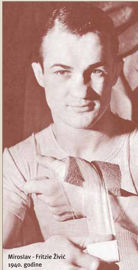
Miroslav - Fritzie Živić 1940. godine

U 18-GODIŠNJOJ PROFESIONALNOJ KARIJERI ŽIVIĆ JE IMAO 230 BORBI. ZABILJEŽIO JE 80 POBJEDA NOKAUTOM, 74 PUTA POBIJEDIO JE NA BODOVE, IZGUBIO JE 61 BORBU, A 10 JE ZAVRŠILO BEZ POBJEDNIKA. JEDNU OD NAJVEĆIH POBJEDA OSTVARIO JE 12. SRPNJA 1943. KADA JE POBIJEDIO JAKEA LA MOTTU, SVJETSKOG PRVAKA U SREDNJOJ KATEGORIJI